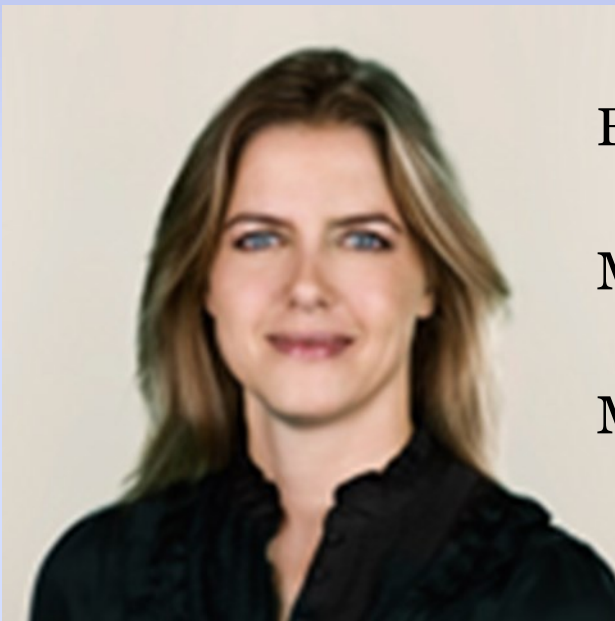
Ellen Trane Nørby

Ministeriet for børn, undervisning og ligestilling