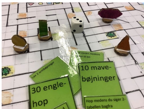
Matematik, bevægelse og Corona-venlig